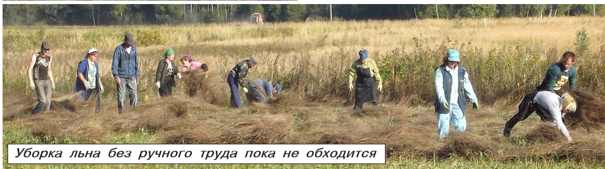
Уборка льна без ручного труда пока не обходится